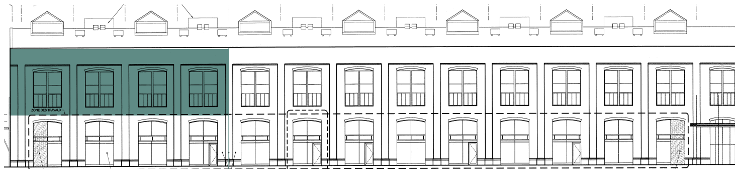
Espace situé à l'arrière du bâtiment